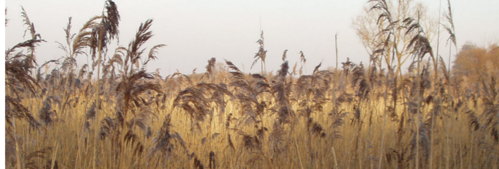
Schilfröhricht im Frühjahr