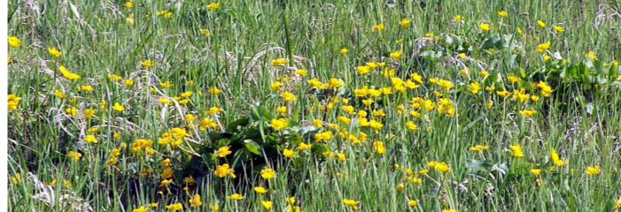
Feuchtwiese mit Sumpfdotterblumen